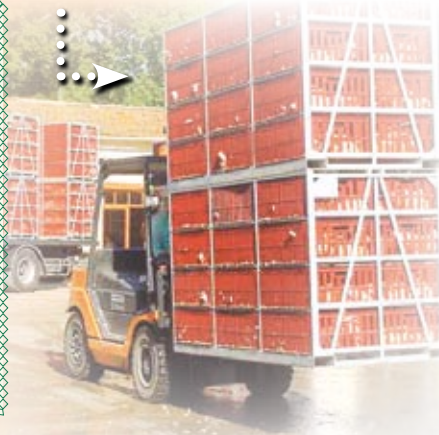
Déchargement des camions Truck unloading