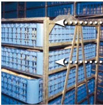
Structure métallique de transport de tiroirs. Metal drawer transport system.

CM2A provides ongoing monitoring of equipment throughout its operating life.