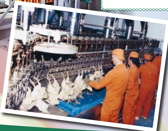
Transfert vers accrochage Transfer to hanging