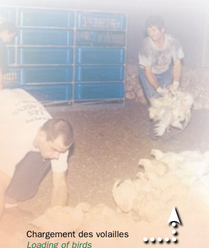
Chargement des volailles Loading of birds