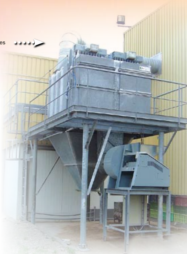
Aspiration poussières Dust extraction