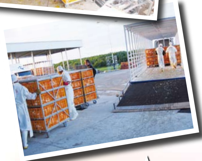
Chariots pour volailles et lapins Poultry and rabbit trolleys