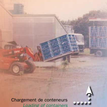
Chargement de conteneurs Loading of containers