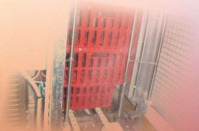
Empileur de caisses Box stacker