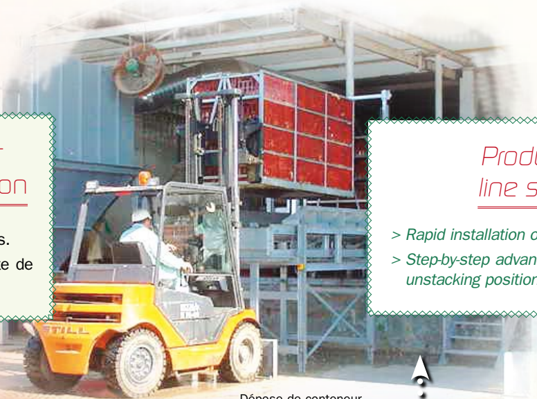
Dépose de conteneur Removal of containers