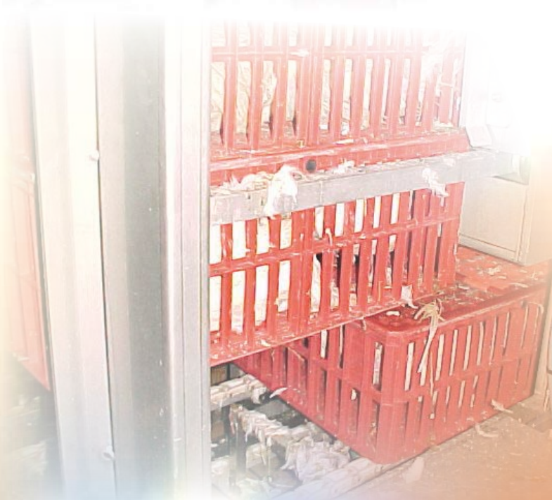
Dépilleur de caisses Box unstacker